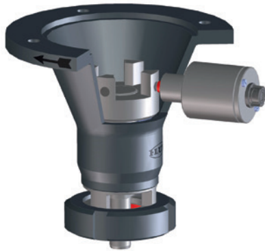
Abb. Variante mit Überwurfmutter