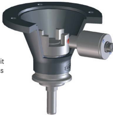
Abb. Variante mit Clamp Anschluss